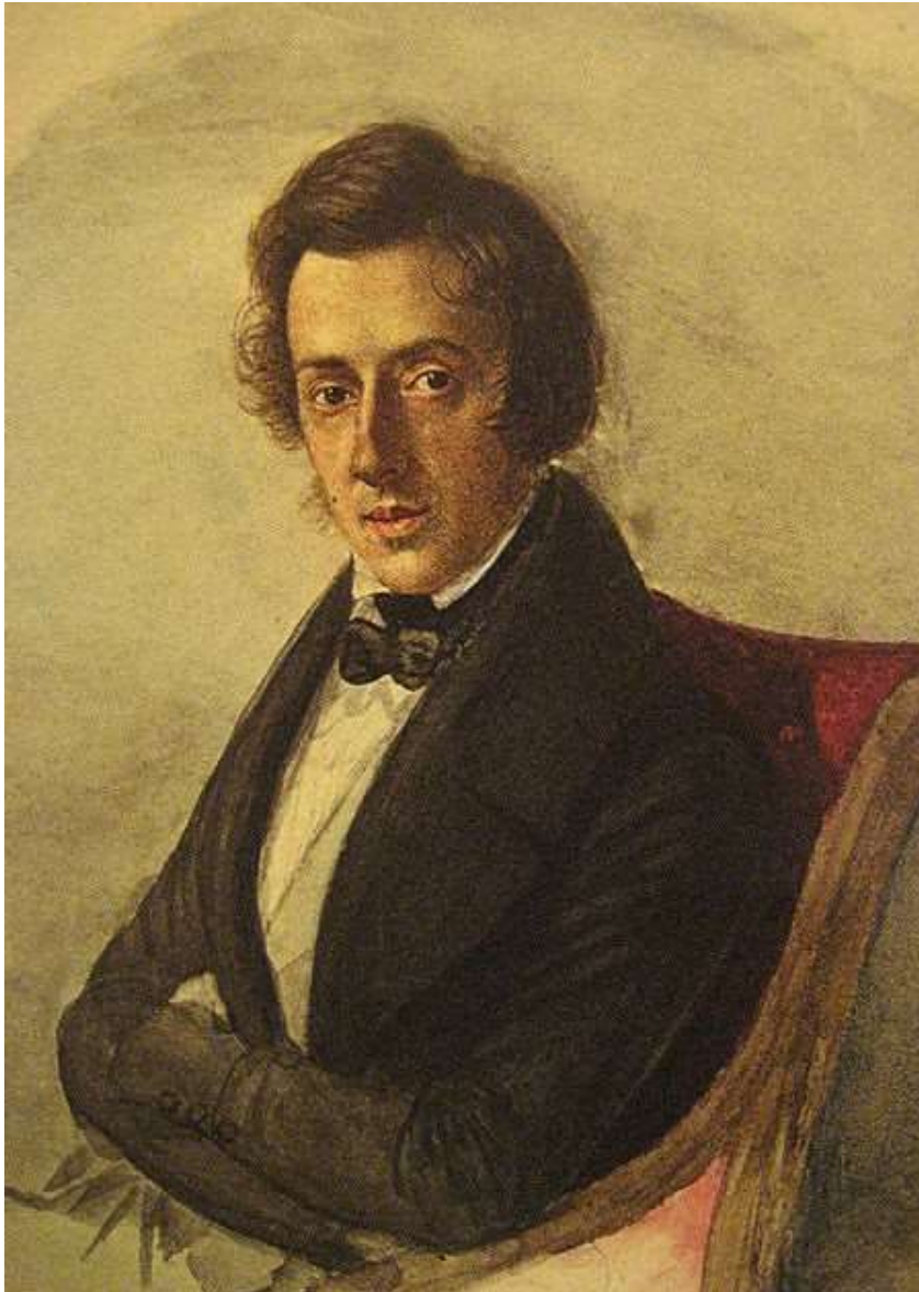
Фредерик Шопен (1810г-1849г)